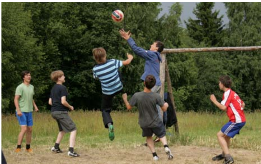
Футбольный матч в Богослово.

летом. К этому выпуску мы прикладываем небольшую летнюю анкету и просим срочно её заполнить и сдать своему классному руководителю. Затем анкеты обработают учащиеся 11 класса и напишут о «нашем» лете в следующем выпуске.