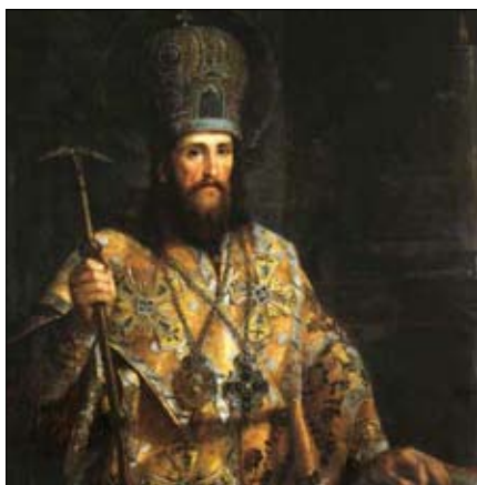
Святитель Димитрий, митрополит Ростовский

9 октября — 20 лет со дня прославления святителя Тихона, Патриарха Московского и всея Руси.