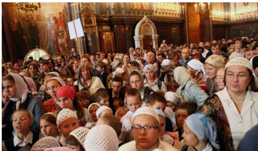
В храме Христа Спасителя.

Н овый учебный год впервые начался с патриаршего молебна. В храме Христа Спасителя больше всего было представителей нашей школы и ПСТГУ. С речью патриарха и кратким отчётом можно познакомиться на сайте «православие.ру».