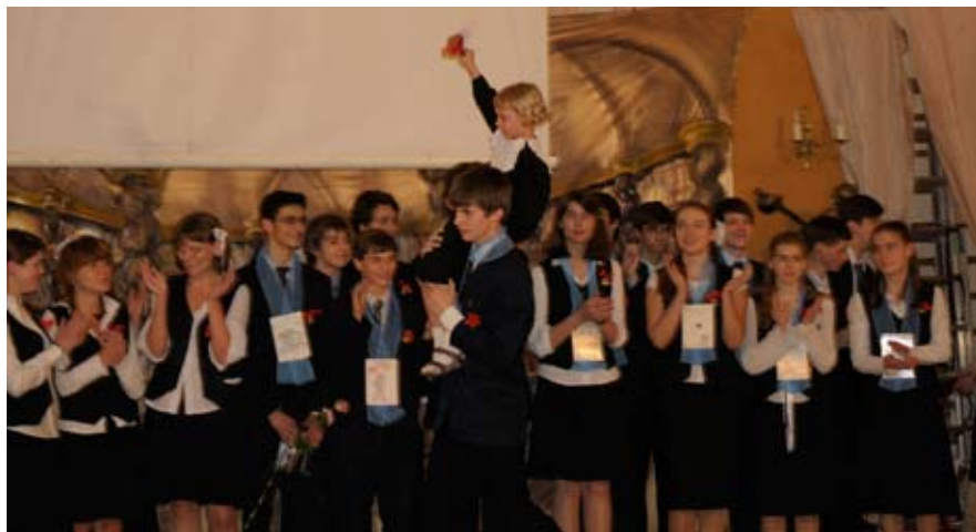
Последний звонок.