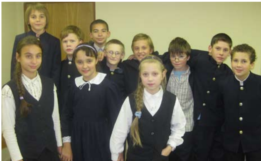
56. теперь уже 66.

Я бы хотел быть учителем каждый день (но работать учителем я бы не хотел!)