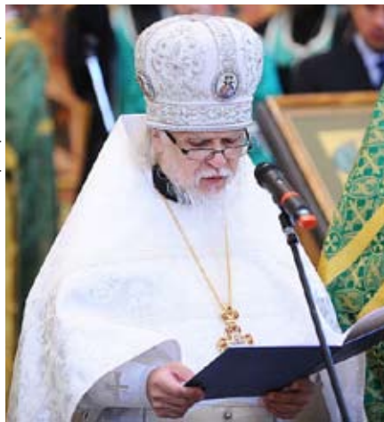
Владыко Пантелеимон.

И зучаем поколения – опять возвращаемся к конкурсу «Единство». Срочно очень нужны инициативные дети готовые изучить наши школьные поколения и размещать об этом новостную информацию. Кроме учащихся нужен учитель – куратор этого проекта. Сроки выполнения работ с 1 сентября по 4 октября.