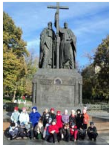
У памятника Кириллу и Мефодию