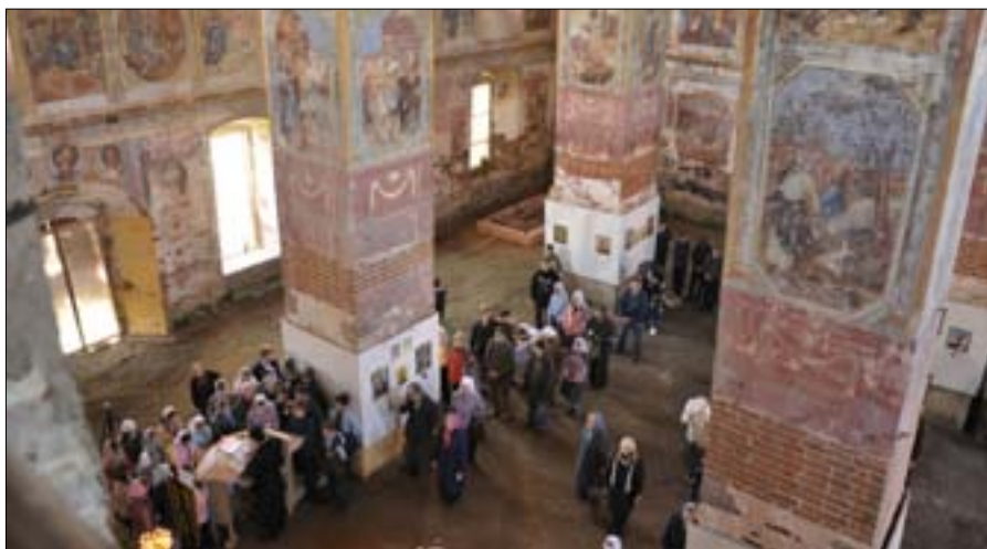
Литургия в храме Рождества Богородицы.

С 20 по 24 сентября учащиеся седьмых классов побывали на II межрегиональном учебном слёте православных гимназий в с. Великое Ярославской области. Кроме учащихся нашей школы во встрече участвовали ученики из Ярославской, Переславской и Тольяттинских православных гимназий, из московской школы «Свет». Впечатлениями о поездке поделились классные руководители и учащиеся седьмых классов.