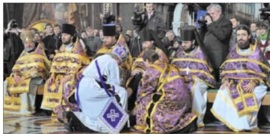
Патриарх Московский и всея Руси Кирилл в Великий четверг совершает чин омовения ног. Крайний справа иерей Филипп Ильяшенко.