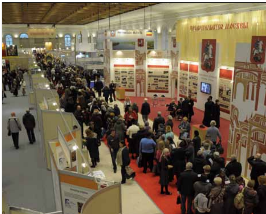
Общая вид выставки и очередь к иконе Живописной Божией Матери. Фотография П. С. Правдолюбова