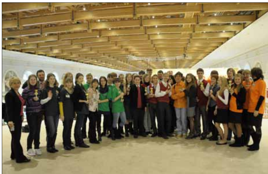
Общая фотография участников финальных мероприятий.

ли жертв интервью и опросов... Домой в результате эти четверо доблестных мушкетёров с ручками и блокнотами вместо шпага и бледно-зеленоватыми футболками вместо голубых плащей вернулись часов в девять-десять.