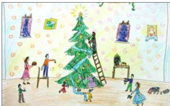
Рисунок О. Шамеевой (9б)

Накануне зимы учащиеся 9 класса вспоминают зеленую красавицу