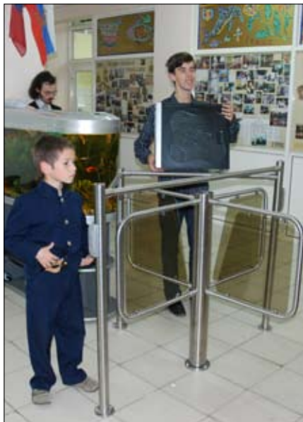
Проезд пока закрыт

Как известно, 4 сентября гимназисты получили электронные карточки. В понедельник (7 сентября) нас ожидал «приятный» сюрприз — заработал турникет. То, что творилось тем утром, можно сравнить только с «часом пик» в метро. Стояла огромная очередь. Карточки почти ни у кого не срабатывали, каждый прикладывал карточку по десять раз, чтобы убедиться, что она не работает, и только потом... его пропускал дежурный.