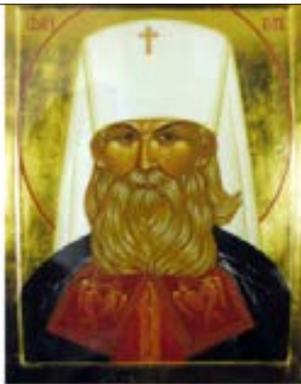
Священномученик Петр митрополит Крутицкий