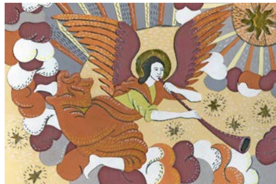
Рождественская открытка по мотивам гравюр XVII века Василия Корени. Екатерина Ордынская, 2015