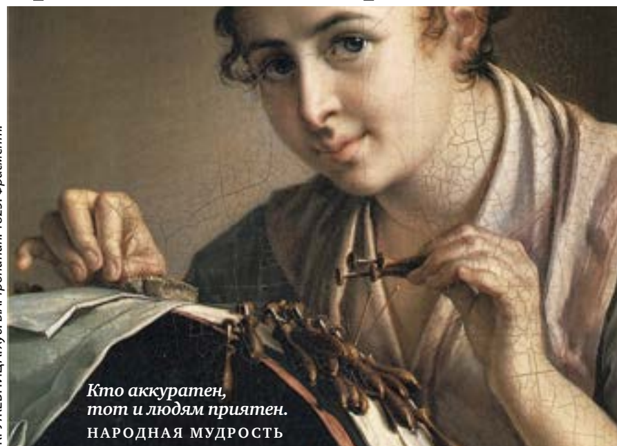
КРУЖЕВНИЦА. Худ. В.А. Тропинин. 1823. Фрагмент.