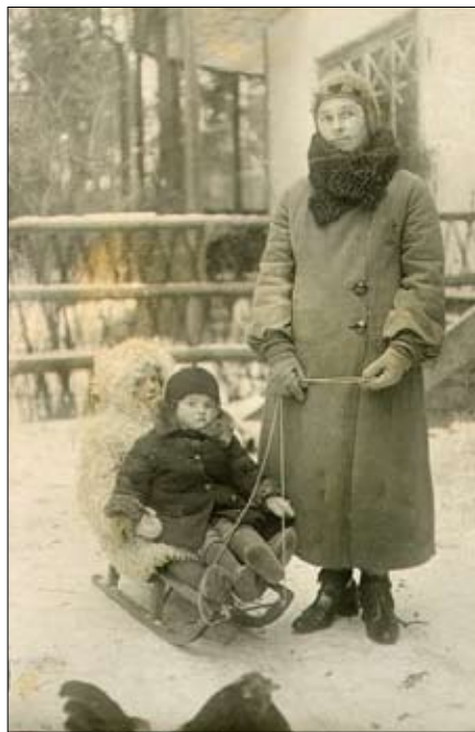
Бабушка с мамой и братом на (42 км) под Москвой. Зима 1941 г.

Школа № 347 находилась у площади Разгуляй. Бабушка хорошо помнит свою первую учительницу, высокую, немолодую Прасковью