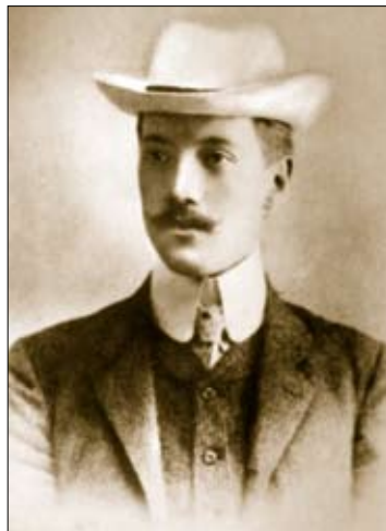
Н. С. Гумилёв. 1909

Вы знаете, что я не красный, Но и не белый — я поэт!