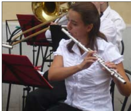
На дне города, 2009

Больше всего в нашем Государстве Российском я люблю «дорогую мою столицу». Мой самый любимый праздник — это День Города, обычно я его праздную