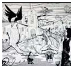
Иллюстрация к книге

19 октября на втором заседании книжного клуба будет обсуждаться пьеса Евгения Шварца «Дракон». Любители кино после прочтения произведения могут посмотреть фильм Марка Захарова «Убить Дракона».