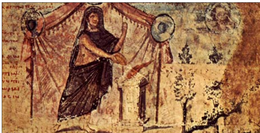
Средневековая иллюстрация к «Илиаде»

рах, дворцах — остались простые и небольшие хозяйства, совсем не роскошные быт и одежда. Но именно в эту эпоху рождался дух великой греческой цивилизации, будущее греческое чудо.